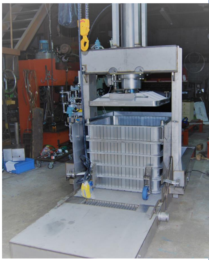
搾り箱キャスター移動式